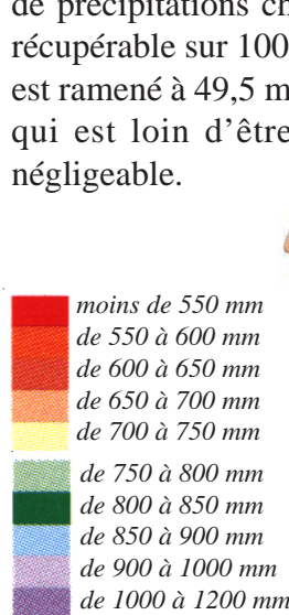
Pluviométrie en Haute-Normandie

Dans une zone plus sèche comme le sud du département de l’Eure, où il ne tombe en moyenne que 550 mm de précipitations chaque année, le volume récupérable sur 100 m 2 de toiture est ramené à 49,5 m 3 , ce qui est loin d’être négligeable.