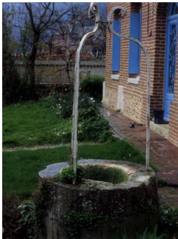
De nombreuses maisons de campagne sont pourvues d'une citerne

Si vous avez la chance de posséder une telle citerne, commencez par voir si elle ne fuit pas. Vérifiez la stabilité du niveau pendant une période de temps sec et lorsque la citerne est pleine. Jaugez sa profondeur, et estimez sa surface, ce qui vous donnera sa contenance. Eventuellement, vidangez-la afin de pouvoir la réparer et/ou nettoyer le fond. Si votre citerne est en briques protégées par un enduit épais, cas fréquent en Haute-Normandie, la restauration peut être menée à bien par un maçon.